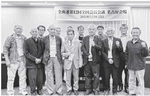
会長会議での集合写真

「初日の太田会長の挨拶の、『要求を持っている業者は自ら闘う力を持っている。明日への展望を語り、自分の民商を自慢できるように会長は、先頭に立ってガンバリ!』との激励を受け、いつもながら元気をもらった」と振り返りました。また、2日目の全体会の活動報告では京都を代表して、この間取り組んできた事を報告