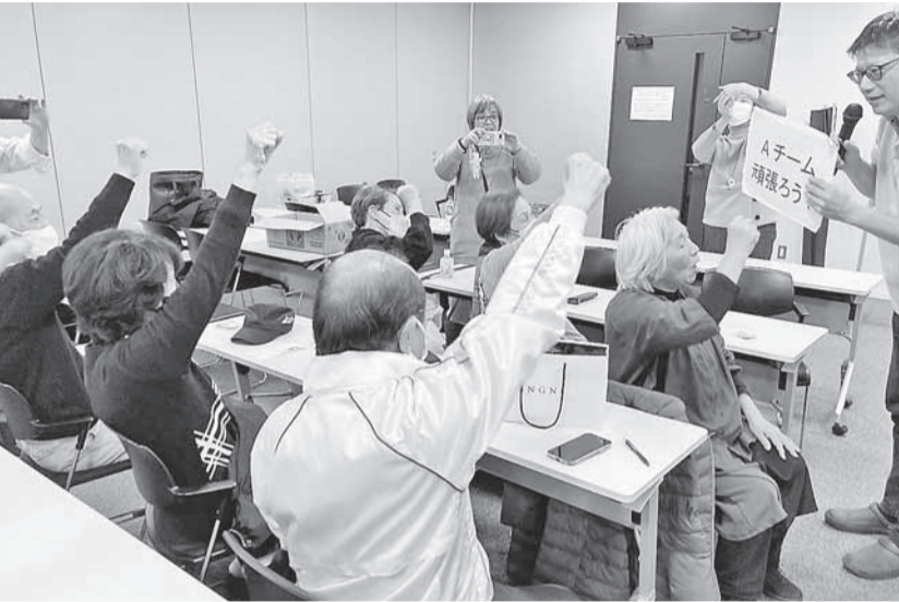
頑張ろう三唱・Aチーム

1月14日京商連は、京都経済センタ にて春の拡大運動決起集会を行いま した。WEBでの参加者も含めて70人 が参加しました。秋の運動に引き続 き、春の拡大運動でも4つのチームに 分かれて拡大が行われます。