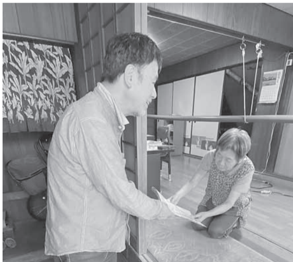
北民商の25日の会員・役員訪問行動

全商連総会当日の25日(土)は午前中に5人が、チラシ配布と会員・役員訪問の2組に分かれてきました。北民商では割安の値段