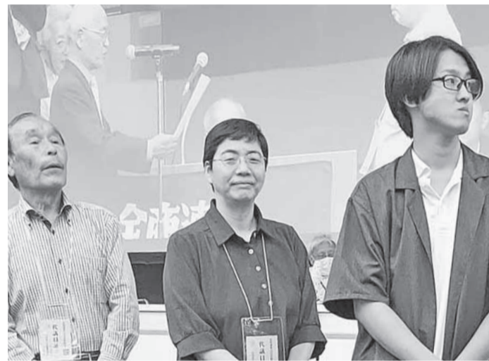
舞台上に並ぶ表彰民商の代表者(中央が南民商の代表)

また祥豊支部では5月17日に拡大ウオッチングに取り組みました。この取り組みで商工新聞の拡大は出来ませんでした。大は出来ませんでした。7社が快く署名に応じてくれました。食品添加物をスーパーに卸している会社では、一部の企業に補助金を出しても