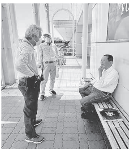
行動の打合せをする三役たち

一緒に訪問行動した役員さんが、ついでに自分の知り合いの電器屋さんへ行ったら、快く購読してくれました。